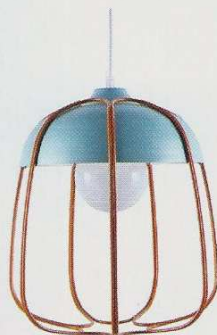
Suspension « Tull » en métal Turquoise/Orange, Ø 36,5 cm, 374€. Incipit sur LightOnline