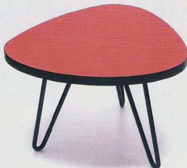
Table « Tica » rouge, inspirées des années 1950, 119€. The Rocking Company