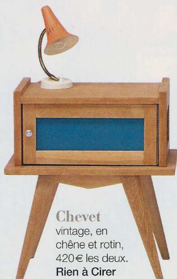
Chevet vintage, en chêne et rotin, 420€ les deux. Rien à Cirer