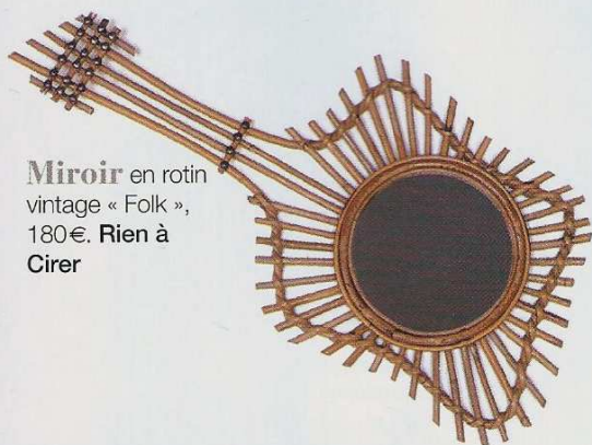
Miroir en rotin vintage « Folk », 180€. Rien à Cirer