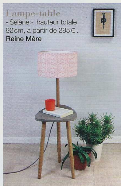
Lampe-table « Sélène », hauteur totale 92 cm, à partir de 295€. Reine Mère