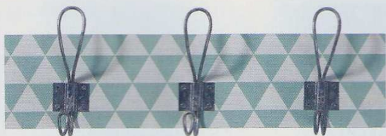
Patère « Vestiaire », en MDF et métal, 40 x 5,3 x 14 cm, 18,90€. Delamaison