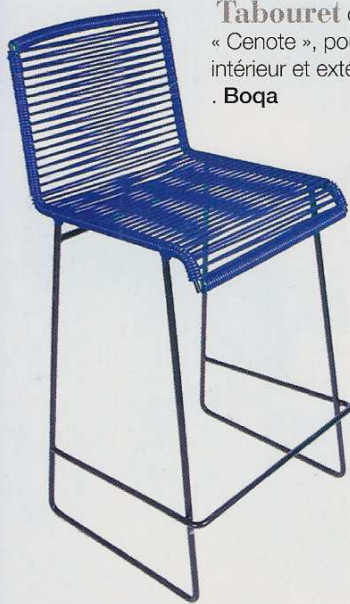
Tabouret de bar « Cenote », pour usage intérieur et extérieur, 229€. Boqa