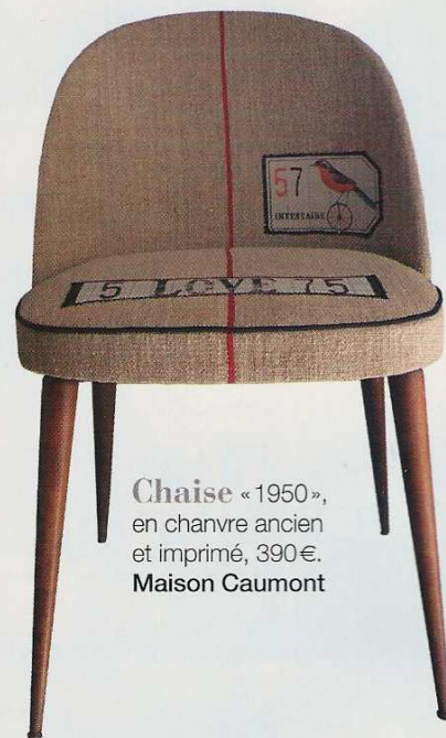
Chaise « 1950 », en chanvre ancien et imprimé, 390€. Maison Caumont