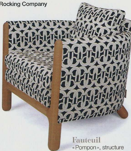
Fauteuil « Pompon », structure en chêne naturel, 2100€. Désio